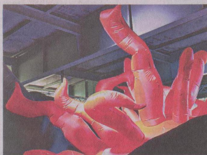
Die Heldenmaschine im Hangar des Flughafens von Gatow führt vor, wie Helden gemacht werden

George-Altar zum „Islamischen Staat“ in einem Minibetonbunker, dahinter hört man schon Greta Thunberg mit ihrem berühmten „How Dare You?“. Ein „Hero-Score“ schlüsselt die einzelnen Elemente des Heroischen auf, die Vermessung der Heldenwelt: So haben Eltern als „stille Helden“ ein Minimum in der Kategorie „Publikum“, aber dafür ein Maximum bei „Vorbild“.